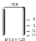
Série PF de 6 à 14 mm