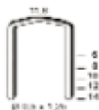
Série FB de 6 à 14 mm